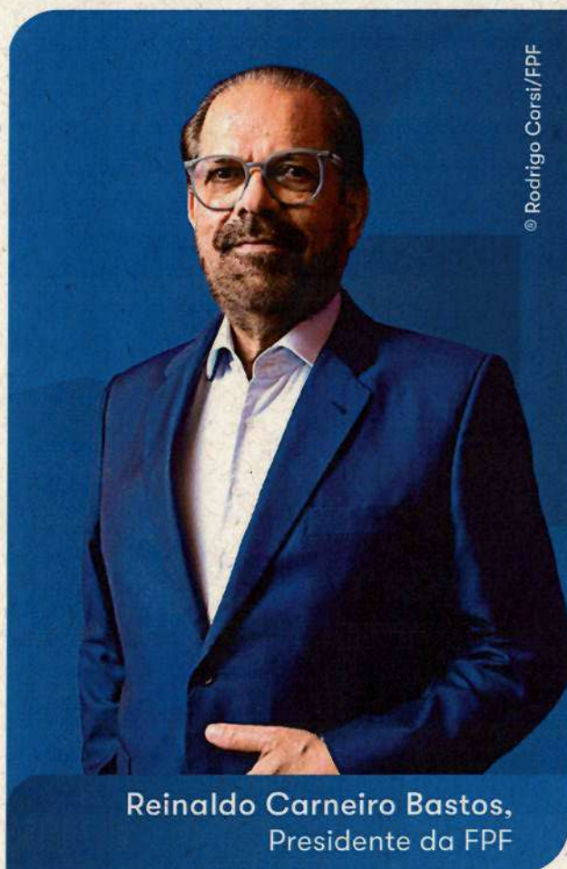
Reinaldo Carneiro Bastos, Presidente da FPF

Nosso compromisso é criar condições para que os árbitros possam evoluir continuamente, com acesso a capacitação de alto nível, preparação técnica e suporte adequado às exigências do futebol moderno.